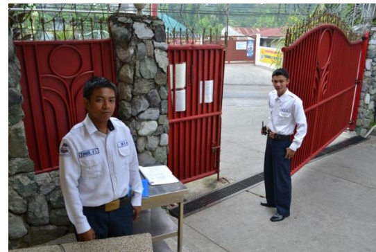
▲セキュリティーガードは2交代6人体制

フィリピンと聞くと危険なイメージを持っている方も多いでしょう。半分は事実ですが、半分は皆様の心がけひとつで半減できることです。しかし、外国人の私たちが安心して過ごせる生活環境を保持することはとても大変です。MMBSが安全な環境であることは、最初は保護者の方と一緒にご留学に来た未成年者のお子様、次からは単身でMMBSに留学に来ることで証明されています。実際に保護者の方が体験し、確認して、満足された結果がここにあります。